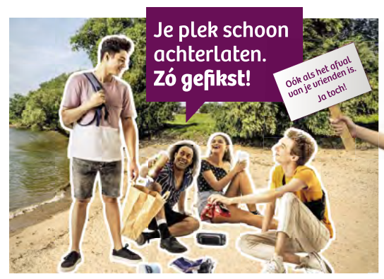
Horizontale poster op A3-formaat