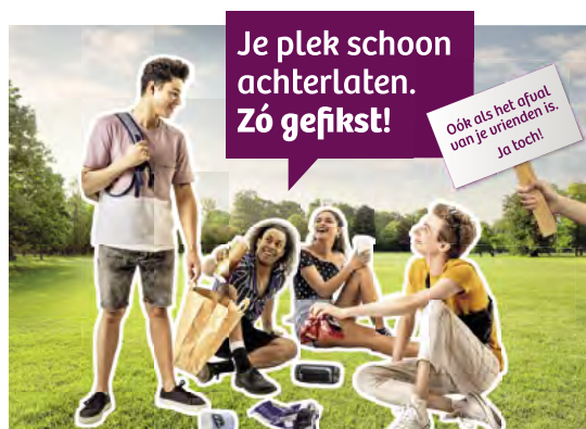
Horizontale poster op A3-formaat