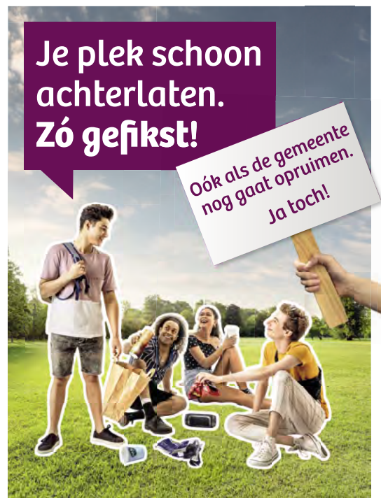
Verticale posters op verschillende formaten