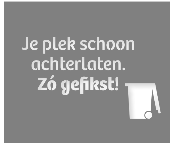
Sjabloon met tekst en iconen en een sjabloon met alleen tekst is beschikbaar op formaat 60 x 50 cm en 100 x 84 cm

Kies voor duurzame graffiti met melkverf (milkpaint). Deze verf is gemaakt van melkeiwit, kalk en natuurlijke stoffen. Het is niet alleen biologisch maar blijft ook langer zitten dan bijvoorbeeld krijtverf.