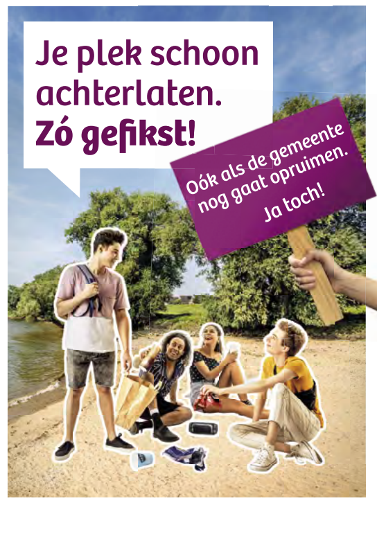
Verticale posters op verschillende formaten